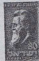
Dr Theodor Zeer Herzl.

1951. — Com. du 23 e Congrès Sioniste. Dent. 14.